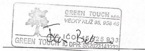
poskytovateľ Green Touch s.r.o. Tomáš Belianský konateľ