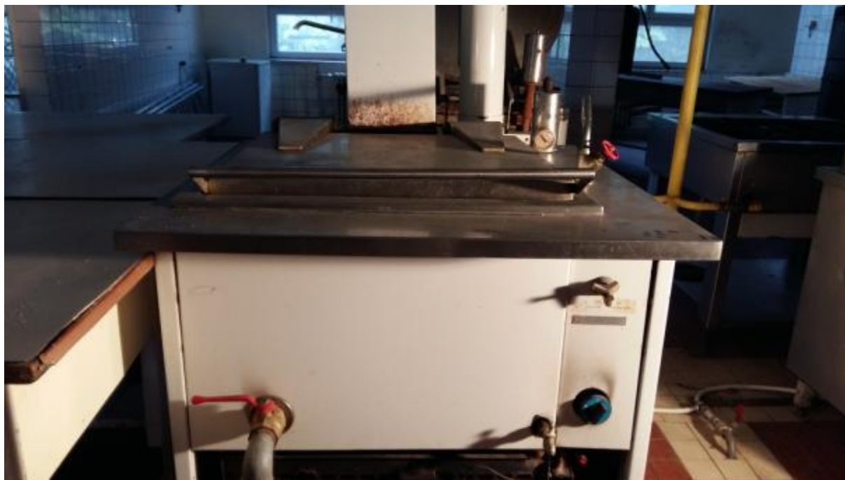
IČ: 13 428