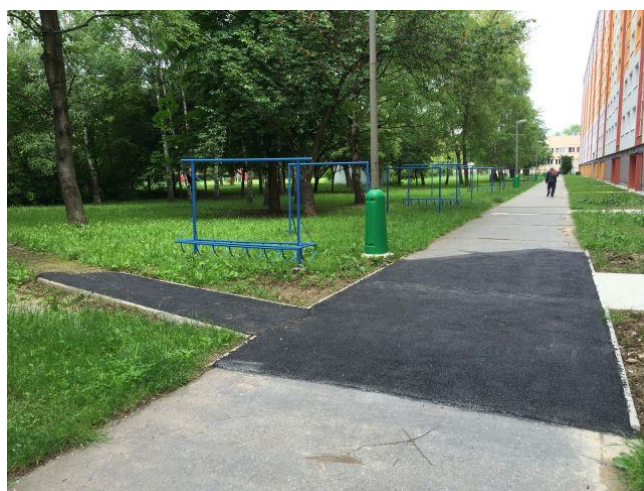
Oprava chodníka na Ul. J. Murgaša