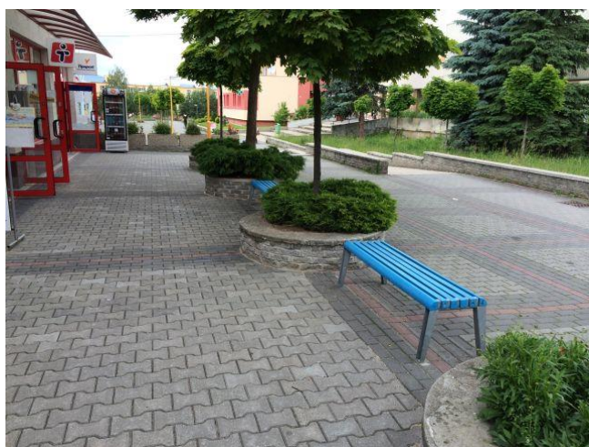
Oprava dlažby na Ul. K. Novackého

Mesto Prievidza vedie podrobnú databázu požiadaviek, ktoré sumarizuje na stretnutiach vedenia mesta s obyvateľmi, na stretnutiach jednotlivých výborov volebných obvodov, ako aj prostredníctvom projektu Odkaz pre starostu alebo obhliadkou chodníkov prostredníctvom odborných zamestnancov. Opravy sa realizujú priebežne, podľa finančných možností mesta.