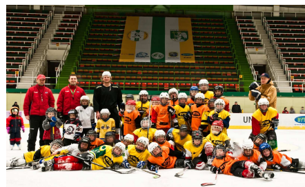
Predprípravkari so svojimi trénermi